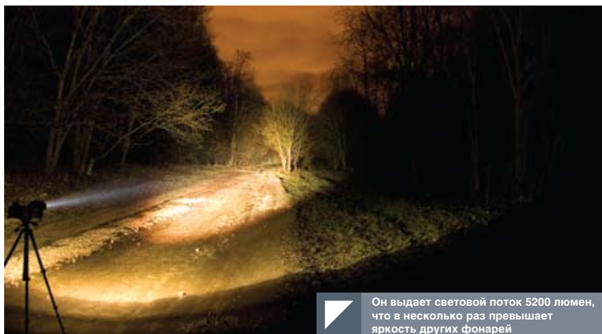
Он выдает световой поток 5200 люмен, что в несколько раз превышает яркость других фонарей

Для его транспортировки и хранения предусмотрен противоударный водонепроницаемый полимерный кейс. Для самого фонаря заявлена макси-