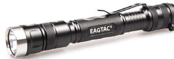
P25A2 Инструкция по эксплуатации

EagleTac P25A2 – компактный ручной фонарь, предназначенный для повседневного бытового использования и рассчитанный на повышенные нагрузки.